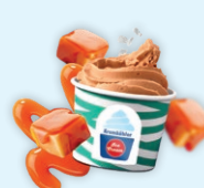
Salted Caramel Gelato