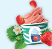
Strawberry Vegan Sorbet