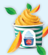
Mango Vegan Sorbet