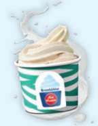
Natural Frozen Yoghurt